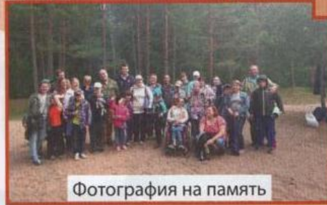
Фотография на память

Именно сюда, в окрестности Большой Ижоры, второй год приезжают петербургские ребята с ограниченными возможностями. Помогают в организации экскурсии Санкт-Петербургский институт природопользования, промышленной безопасности и охраны окружающей среды, редакция журнала «У Лукоморья» и общественная организация «Здоровая страна». Ребята знакомятся с миром природы верхового болота, в восторге от почти двухметрового муравейника, любят шишкинским вековым бором и покачивающейся на волнах лебединой стаей, сажают деревья, развешивают дуплянки и отражают свои впечатления на своих рисунках. Как отмечают сопровождающие их мамы, такая экскурсия дает многое ребятишкам. Во-первых, она на природе и пронизана массой впечатлений, во-вторых, идет познание окружающего мира, в третьих, оставляет добрый и теплый след в душе ребенка.