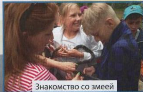
Знакомство со змеей